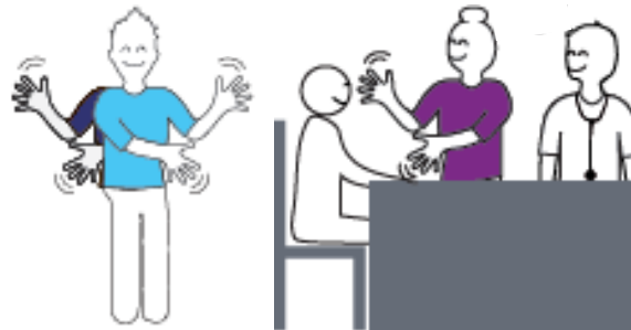
IM Si besoin