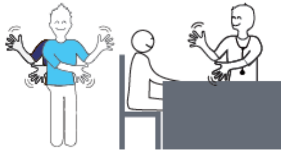
IM Si besoin