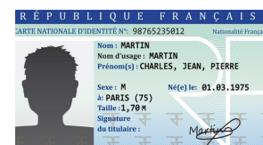
Pièce d'identité (carte d'identité, passeport...)